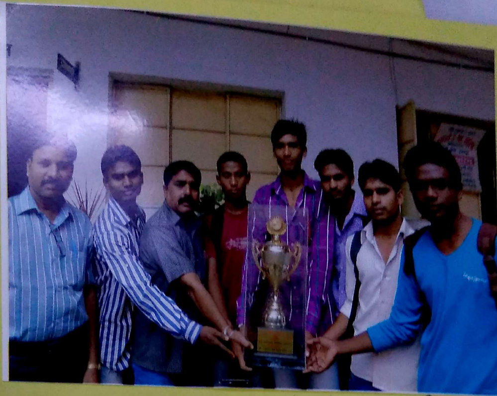
सिटी बल्लन द्वारा आयोजित अंतरिम वि. बॉली बॉल प्रतियोगिता में विजेता इम्फ्री ११ नवम्बर २०१५-१६