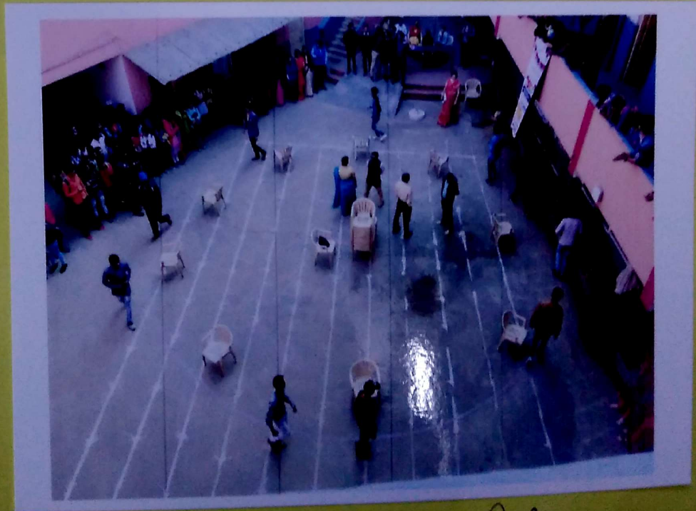
पारिवर्तन खेल उत्सव के तहत कुर्सी बॉल ०७ नवम्बर २०१६